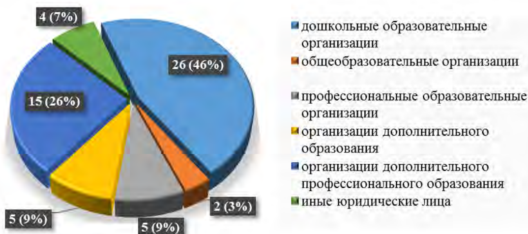
Рис. 5. Структура проведенных проверок в 2017 году в разрезе типов организаций, осуществляющих образовательную деятельность

Структура проведенных проверок в 2017 году по вопросам осуществления контроля за соблюдением лицензиатами лицензионных требований и условий при осуществлении образовательной деятельности в разрезе типов организаций, осуществляющих образовательную деятельность, представлена на рисунке 5.