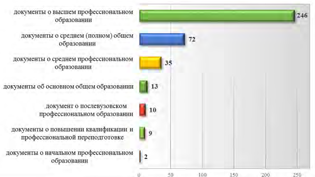
Рис. 7. Структура документов об образовании и (или) о квалификации, по которым было принято решение о подтверждении в 2017 году

образовании и (или) о квалификации, по которым было принято решение о подтверждении.