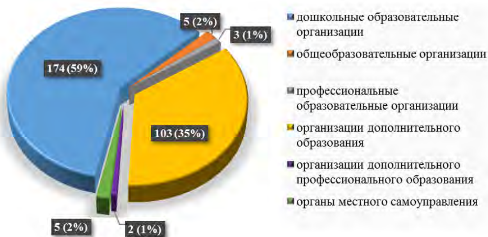
Рис. 2. Структура проведенных проверок в 2017 году по вопросам осуществления федерального государственного надзора в сфере образования в разрезе типов организаций, осуществляющих образовательную деятельность

Структура проведенных проверок в 2017 году по вопросам осуществления федерального государственного надзора в сфере образования в разрезе типов организаций, осуществляющих образовательную деятельность, представлена на рисунке 2.