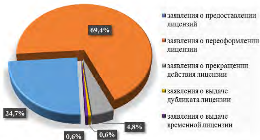
Рис. 3. Сведения о поданных заявлениях о предоставлении государственной услуги по лицензированию образовательной деятельности в 2017 году в разбивке по процедурам

В 2017 году в Ростобнадзор поступило 539 заявлений от соискателей лицензии и лицензиатов о предоставлении лицензии, временной лицензии, переоформлении лицензии, выдаче дубликата лицензии, а также о прекращении осуществления образовательной деятельности (рисунок 3).