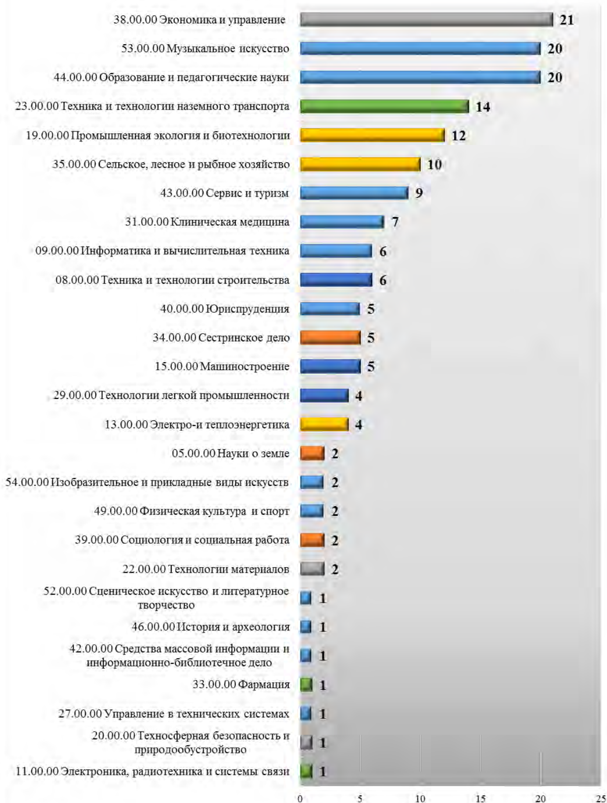
Рис. 6. Структура аккредитационных экспертиз, проведенных в 2017 году, в разрезе укрупненных групп профессий и специальностей

подготовки рабочих кадров и специалистов среднего звена являются программы, реализуемые в рамках укрупненных групп «38.00.00 Экономика и управление», «53.00.00 Музыкальное искусство», «44.00.00 Образование и педагогические науки», «23.00.00 Техника и технологии наземного транспорта».